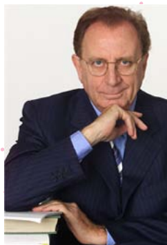
Prof. MICHELE MIRABELLA

Promotrice silenziosa del cinema italiano, ha attirato una grande attenzione mediatica di pubblico e critica con l'intuito e la grande esperienza accumulata davanti alla cinepresa. Nel corso della sua carriera di attrice di cinema ha ottenuto numerosi premi: vincitrice di sette David di Donatello, sette Nastri d'Argento, cinque Globi d'oro e tredici Ciak d'oro. Annotata tra le migliori attrici italiane.